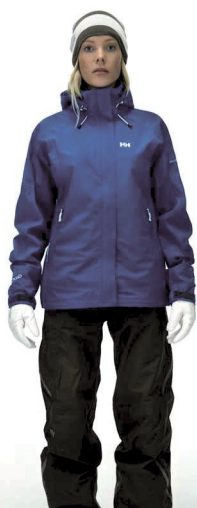
Ekolab North Marker Jacket + Pant (W)