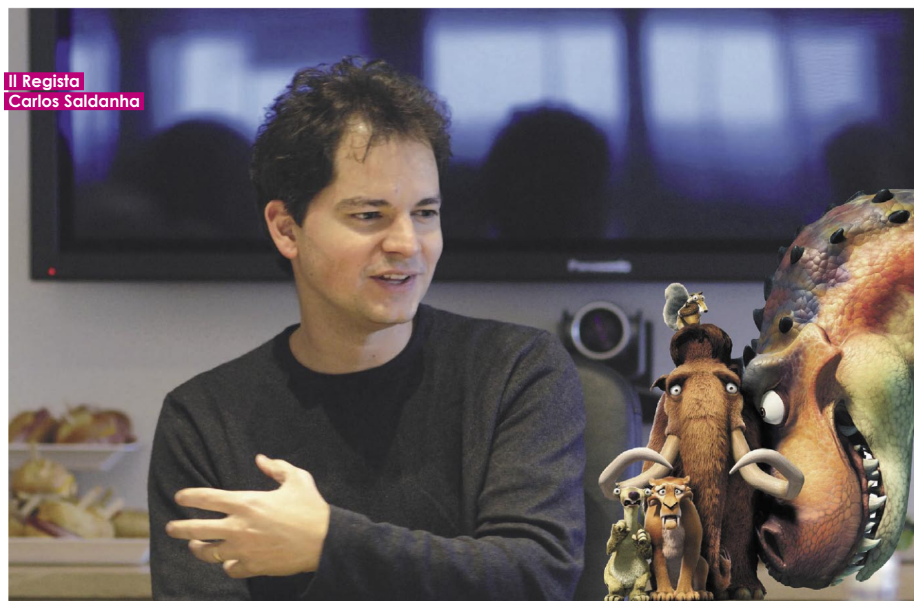
Il Regista Carlos Saldanha

condo sforzo con Chris Wedge, quello di dirigere "Robots". Robots non è un successo ma è solo un riscaldamento prima de "L'era glaciale 2 - Il disgelo" (2006), questa volta diretto in solitario da Saldanha, si rivela un secondo campione d'incassi. Contrariamente alle aspettative il secondo capitolo è forse ancora più divertente del primo. Carlos si diverte e lo dimostra interpretando nella versione americana il Dodo (grossa gallina estinta un secolo fa). Nel 2009 arriva il terzo capitolo della serie: "L'era glaciale 3 - L'alba dei dinosauri". Condito di citazioni per far contenti anche i genitori il film è divertente ma inizia a mostrare le prime debolezze. Il brasiliano Carlos Saldanha ha d'altra parte in pre-produzione un nuovo lavoro d'animazione intitolato Rio, previsto per il 2011.