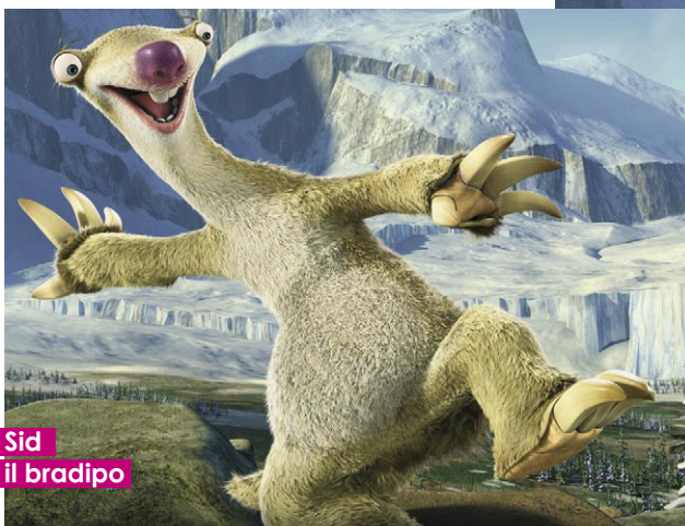
Sid il bradipo

Un film d'animazione del 2009, diretto da Carlos Saldanha e sceneggiato da Michael Berg e Peter Ackerman. Il film è uscito nelle sale cinematografiche statunitensi il 1° luglio 2009, mentre nelle sale cinematografiche italiane è uscito il 28 agosto 2009. Ad Ischia, nel corso dell'Ischia Global Film Festival è uscito nella settimana tra il 12 e il 19 luglio riscuotendo molto successo sia tra i bimbi che tra gli adulti.