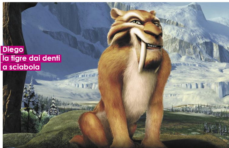
Diego la tigre dai denti a sciabola

Il 2002 è l'anno in cui sfonda sulla scena internazionale: sempre con Chris Wedge co-dirige "L'era glaciale" ed è un successo. Distribuito dalla 20th Century Fox , "L'era glaciale" è uno dei film di animazione di più grande impatto della storia, capace di adombrare i quotatissimi film Disney o Pixar. È la terza pellicola come successo al botteghino nella storia dell'animazione, dietro solo a "Monsters & Co" e "Toy Story 2". Sulla scia del successo, nel 2002 Carlos dirige il corto di cinque minuti "Gone Nutty" per cui viene candidato agli Oscar. Nel 2005 un se-