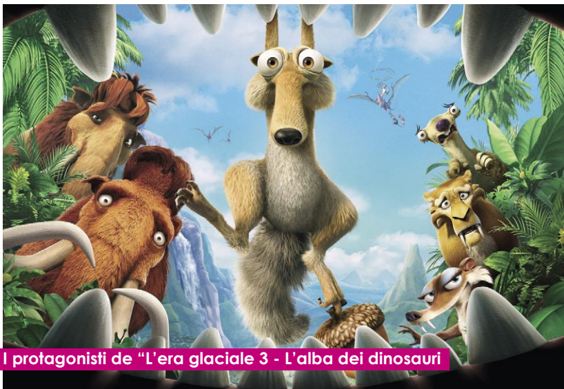
I protagonisti de "L'era glaciale 3 - L'alba dei dinosauri"

Terzo capitolo della saga glaciale: divertente e condito di riferimenti alti, con un uso superfluo del 3D.