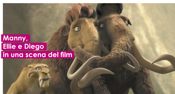
Manny, Ellie e Diego in una scena del film