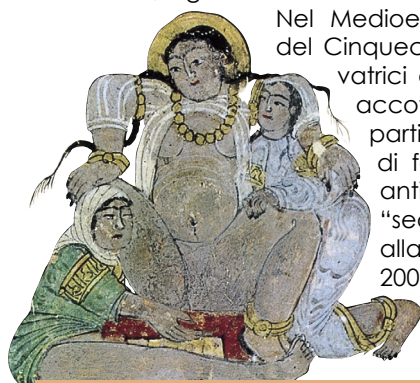
Iran: Illustrazione tratta da un manoscritto iraniano del 1237 che raffigura un parto.

Un'analisi storica dell'evoluzione delle posizioni materne durante il parto rivela che le posizioni supina (o litotomica, così chiamata perché usata in chirurgia per gli interventi di rimozione di calcoli dalla vescica urinaria) e semidistesa sono innovazioni che coincidono con la medicalizzazione della nascita. La maggior parte delle culture nel mondo ha usato, o usa tuttora, per il travaglio e il parto, posizioni diverse: eretta, seduta, accovacciata, inginocchiata.