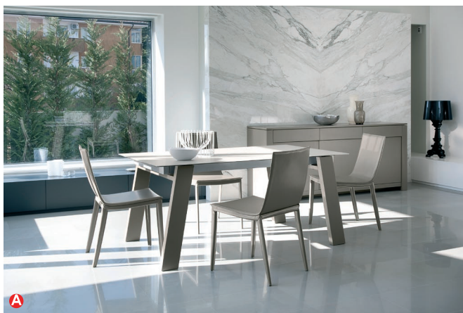
Tavoli allungabili: A Must; B Galaxy

Domitalia per il 2012 sceglie di utilizzare materiali di pregio unendoli in modelli unici che si caratterizzano per il design pulito e crea tavoli adatti agli ambienti contemporanei e quindi dotati allo stesso tempo di praticità e bellezza.