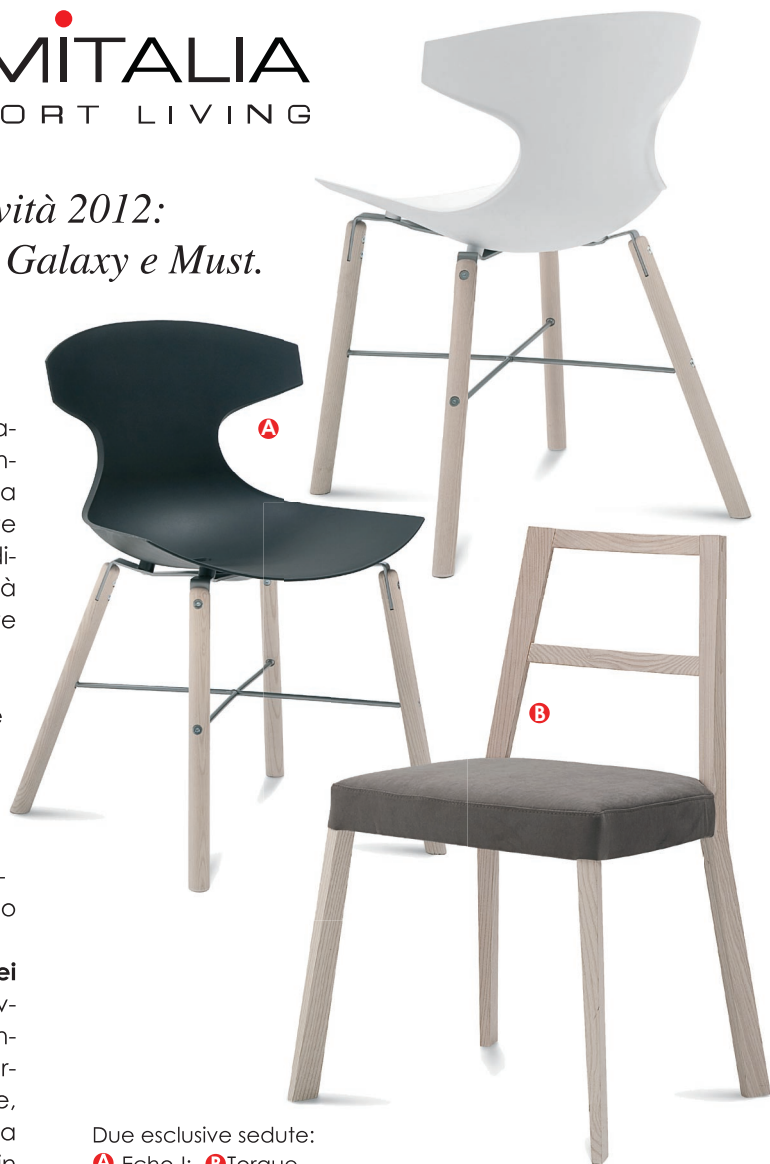
Due esclusive sedute: A Echo-I; B Torque

Must , realizzato in legno, anch'esso con piano in vetro acidato, si contraddistingue per la grande estensibilità frutto di meccanismi funzionali come l'apertura