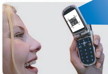
Centra il codice all'interno degli indicatori del programma e automaticamente il programma leggerà il codice da te scelto.