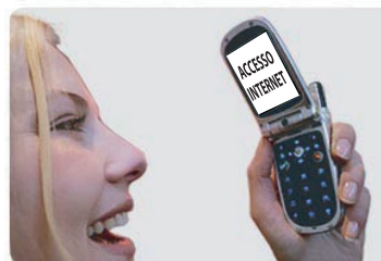
Accesso a Internet