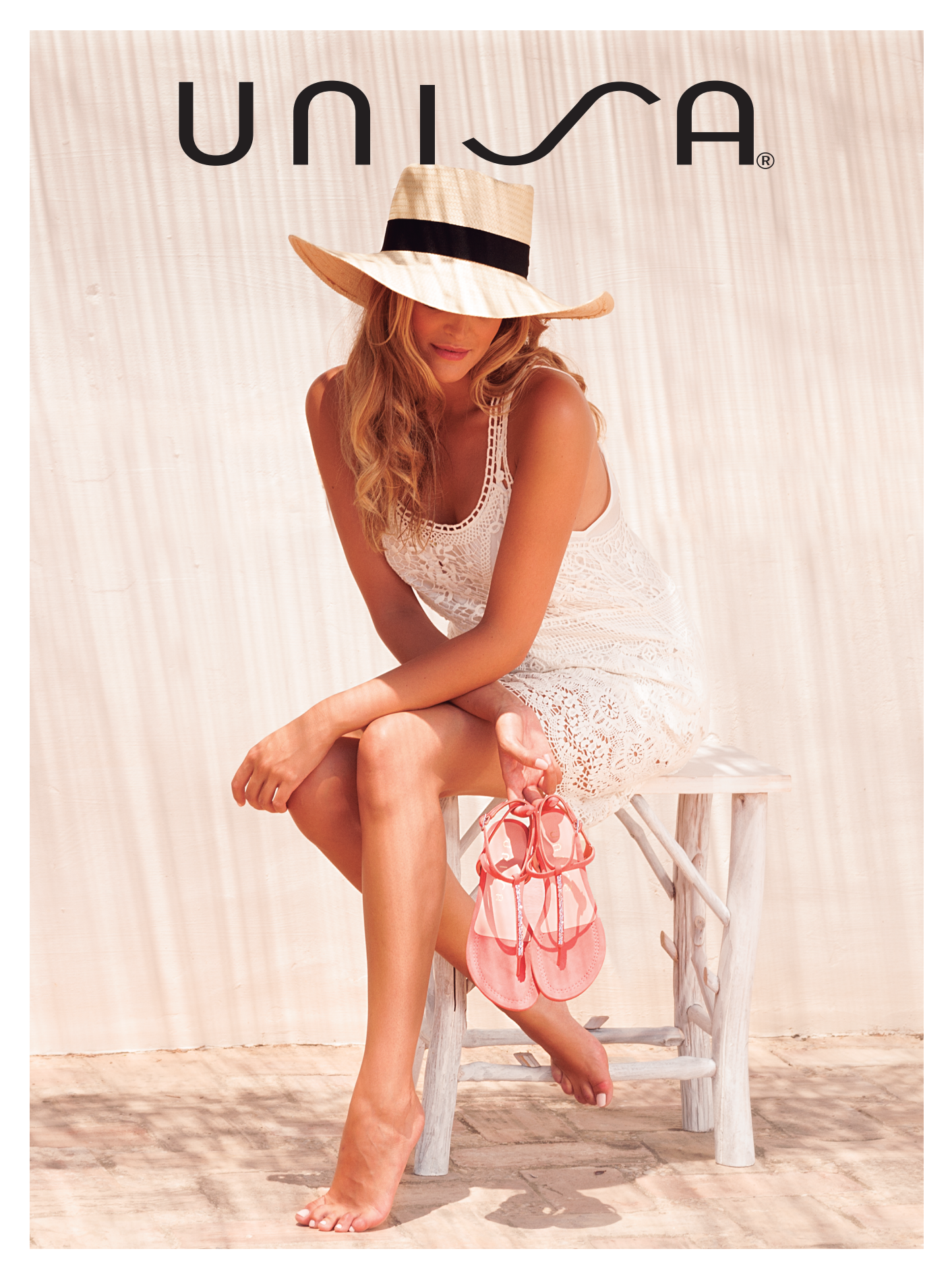
UNISA is a Spanish footwear brand internationally renowned. Its designs are mainly known for comfort and for the quality of the materials used, that is the reason why a large amount of women trust and seek for the brand; it's a company that adapts fashion to modern women's lifestyle and comfort.